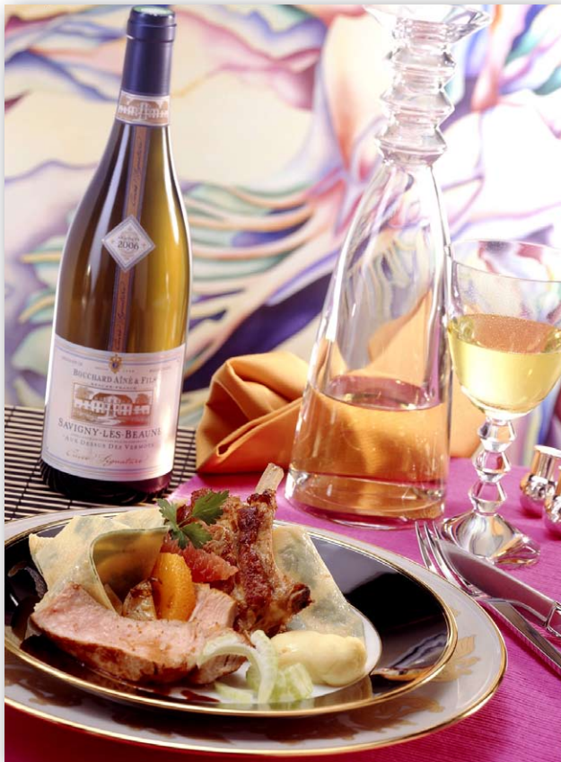
Restaurant L'Oranger à Londres

Ces six recettes sont illustrées de six photos de Marcel Ehrhard, véritables tableaux qui habilleront désormais la cave de ce menu des chefs qui fait la part belle à l'Asie avec le Japon et la Chine de Honk Kong, au Canada avec un cerf à la ficelle, aux États-Unis avec un Napoléon de crabe, l'Angleterre et son carré de veau rôti et naturellement la France avec un homard terre-mer, recette spécialement créée pour l'occasion.