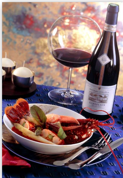
L'Hostellerie de Levernois à Beaune