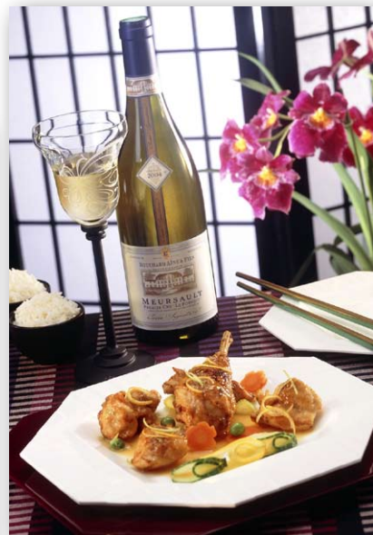
Restaurant MING YUEN à Hong Kong