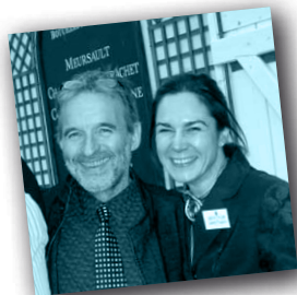
Restaurant Joe Beef à Montréal

Et comme écrin pour ces plats, les plus belles marques des Arts de la Table : Baccarat signe les verres, Puiforcat les couverts et la Manufacture Royale de Sèvres la porcelaine ; des pièces uniques superbement parées par notre styliste culinaire.