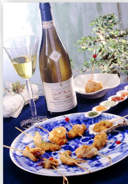
Restaurant Kushinobo à Tokyo